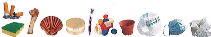
Hygieneartikel, Geschirr, Essensreste, Zigarettenstummel, Kunststoffobjekte (nicht elektrisch)