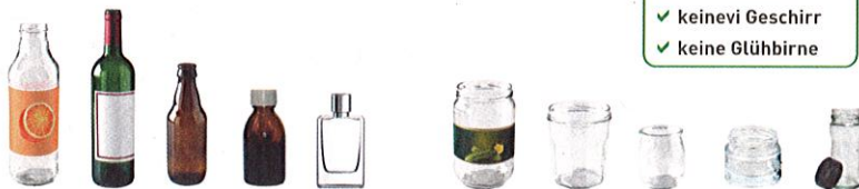
Glasflaschen und gläser