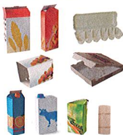
Karton und Tetra Packs